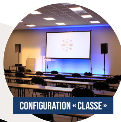
CONFIGURATION « CLASSE »