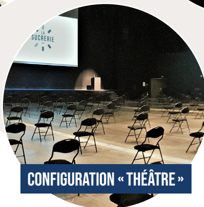
CONFIGURATION « THÉÂTRE »