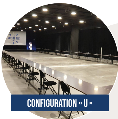
CONFIGURATION « U »

ORGANISER VOTRE ÉVÉNEMENT À LA SUCRERIE, EN MODE « DÉCONFINEMENT » C'EST POSSIBLE !